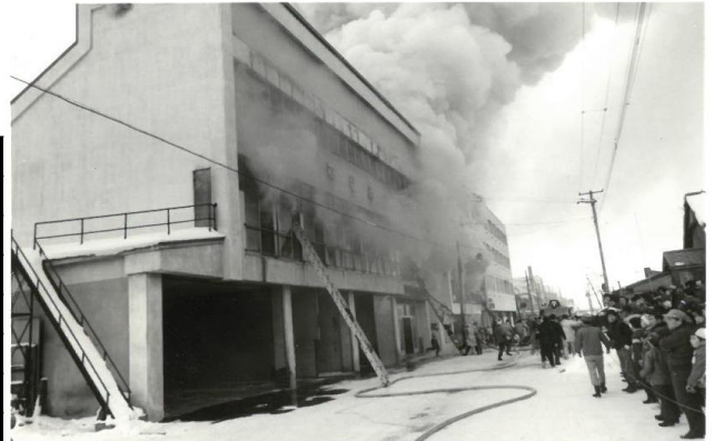
昭和53年 倶知安町内宿泊施設火災