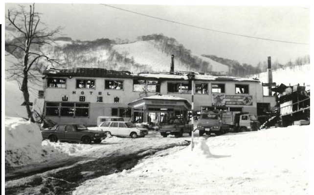
昭和54年 倶知安町内宿泊施設火災