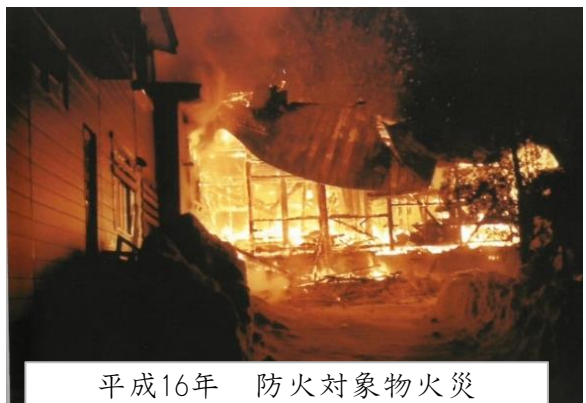
平成16年 防火対象物火災