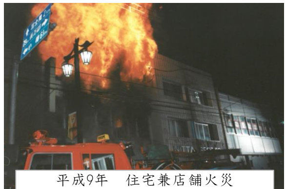
平成9年 住宅兼店舗火災